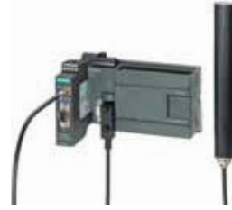
SINAUT MD720-3 GSM/GPRS Modem