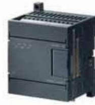
SIWAREX MS Tartım Modülü