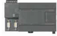
CPU 224 XP